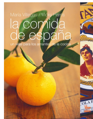
LA COMIDA DE ESPAÑA