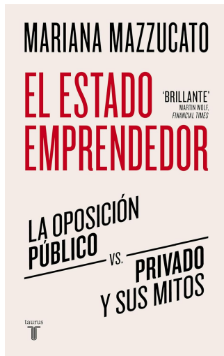
EL ESTADO EMPRENDEDOR