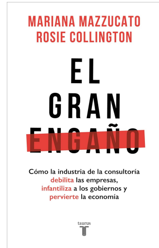
EL GRAN ENGAÑO