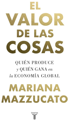
EL VALOR DE LAS COSAS