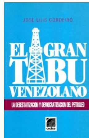
EL GRAN TABU VENEZOLANO: LA DESESTATIZACION Y DEMOCRATIZACION DEL PETROLEO