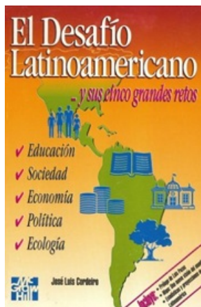
EL DESAFIO LATINOAMERICANO