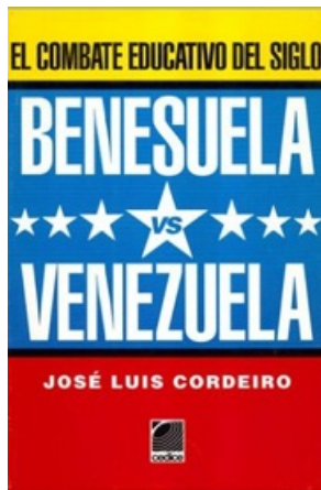
BENESUELA VS. VENEZUELA: EL COMBATE EDUCATIVO DEL SIGLO