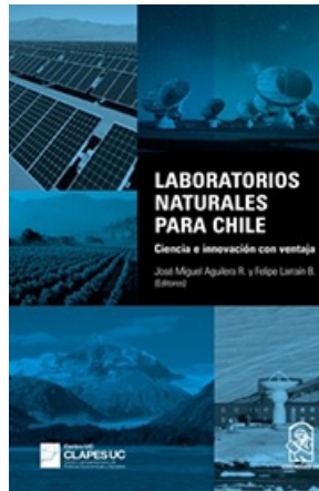
LABORATORIOS NATURALES PARA CHILE