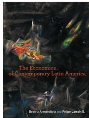
THE ECONOMICS OF CONTEMPORARY LATIN AMERICA