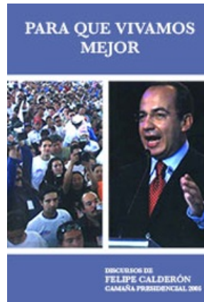
PARA QUE VIVAMOS MEJOR