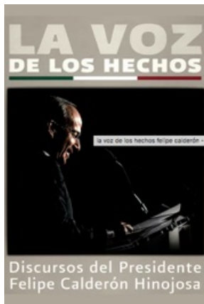
LA VOZ DE LOS HECHOS