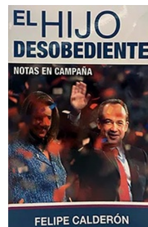
EL HIJO DESOBEDIENTE